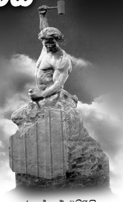
ජගත් ජේ එදිරිසිංහ

කාලය බොහෝ දුර අප ගෙන ගොස් ඇති බව පසක් වන්නේ ඉඳු හිට ය. ඒ අතර පාසල් සිසුවකුට ගෙවූ හැට්ටර විදේ මහත සටහන්ද වරින් වර සිත මතුපිටට පැමිණෙන්නේ එක්තරා සතුටක් ද සිනේ ඇති කරවමින් ය.