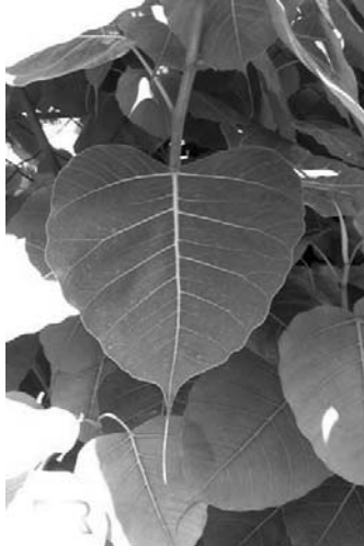
දුටුව පබෝදය වන සහ සිත පවතින බෝ පුද්ගල වේ පෙයසින් මුලි පිරිබෝ කළ මුනිපාදුවෙන් බිඳ සිරිමා බෝ දානම් පැදකුණෙන් නිබද ගොමද බිඳ පැද

බෝධි සාහිත්‍යයේ ඇතුළත් වේ. අනාගතයේ බුදුවන බවට සඳහන් වී ඇති මෙහිදී බුදුන් වහන්සේ හා ගසක් මුලේ නිවන් අවබෝධ කරන බව අනාගත වශ දේශනාවේ සඳහන් වෙයි. මෙ මනා හදු කල්පයේ සිවුපවනුව බුදු වූ අප ගොතම බුදුන් වහන්සේ ඇසතු ගසක් බෝ මෙයි කර ගන්න.