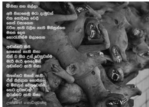
මී හිසා සහ බිල්ලා අපි සිනාසෙමු මිරා දැනුවත් එක පොදියෙ වෙලී කෙත් වසාගෙන වර්ග ඇති වලිග නැති මිනිසුන්ගේ මිනස දෙස නොරැකිම බලාගෙන අඩිත්තට කිසි කෙතෙක් නැති හිසා ගිස් වී හිය උත් වෙනුවෙන්ම මැරී මැරී ඉපදෙමින් අඩිත්තට ඇති හිසා සිතන්නට සිතක් ඇති ඒත් සිහිදාන නොසිතන එ මිනිසුන් වෙනුවෙන්ම නෙට දවසටත් බුරුන්ගේ ඇති හිසා ලක්මන් කොටසුවත්තු

පුත බලන්න ගැඹුණු හිරු බලන්න පුත බසින හිරු බැස ගැඹුණු එන හිරු බලන්න අවදිවන්න, අවදිවන්න පුත