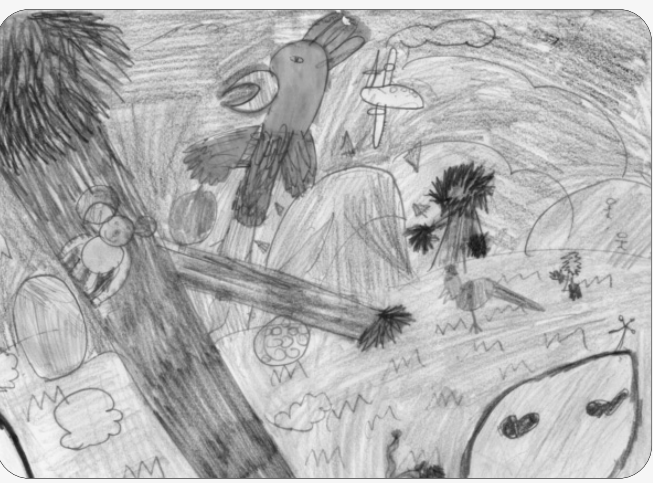
Ramiru Kandambi. Grade 3 Epping View Primary School