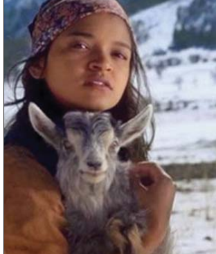
මොහල් දුටු පොත කියවලා ලැබුවේ පුදුම රසයක්. අපටත් ඕනෙ වුණා උපාලි හිනිවල්ලේ වගේ පාල දුපකක් හොයාගෙන යන්න. ඒ වීර රසයන් එක්ක අපි මවා ගන්න සුරංගනා ලෝකයක් තිබුණා.

හටකතාවක් චිත්‍රපටියකට ගන්න එක ගැන මගේ හිතට ඇතිවල මුල්ම අත්දැකීම වුණේ මොහල් දුටු. අපි පුංචි කාලේ මාර්ටින් චිත්‍රපටිය ගන්නකගෙන