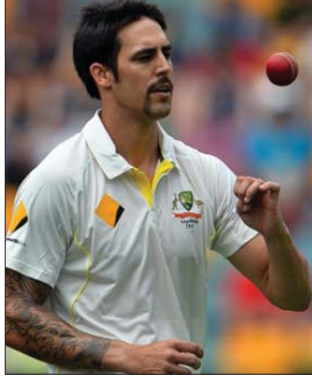
මෙහිත් අපේ බොක්කෙන්ම එන ගොරුවය හා ආදර්ශ පිලිගන්න මෙහි සේවයට හා ආදර්ශයට මෛලේ ඡේන්පත්. වෙල් ඩන් මයිට්.

වොන්ට පස්සේ ආපු බෝලර්ලාගෙන් මට නම් අල්ලොම හිසේ මෛලේ ඡේන්පත්. උෆා වොන්ට එනා. මිනිගෙන බවුන්සර් වලට බැටියන්ගලා ඇඹරෙන හැමි දැක්කම පියස්සු හැදලෙනවා. මිනිගන්