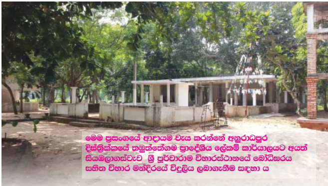
මෙම ප්‍රසංගයේ ආදායම වැය කරන්නේ අනුරාධපුර දිස්ත්‍රික්කයේ තමුන්තේගම ප්‍රාදේශීය ලේකම් කාර්යාලයට අයත් සියම්ලාගස්වැව ශ්‍රී පුරවාරාම විහාරස්ථානයේ බෝධිසරය සහිත විහාර මන්දිරයේ විදුලිය ලබාගැනීම සඳහා ය

සංවිධානය වී සිටීම සතුටට කරුණකි. මෙම සංගමයේ අරමුණු ඉතාම සමාජයට වැඩිදායී කරුණු වලින් සමන්විතයි. තරුණ පිරිස වැඩිදායී ලෙස සමාජයට සම්පූර්ණ කිරීම, උසස් පරමාර්ථ හා අරමුණු පෙරදැරිව සංස්කෘතිකමය සමාජ පසුබිමක් අප සමාජයට දායක කිරීම, දෙමව්පියන් දරුවන් හා