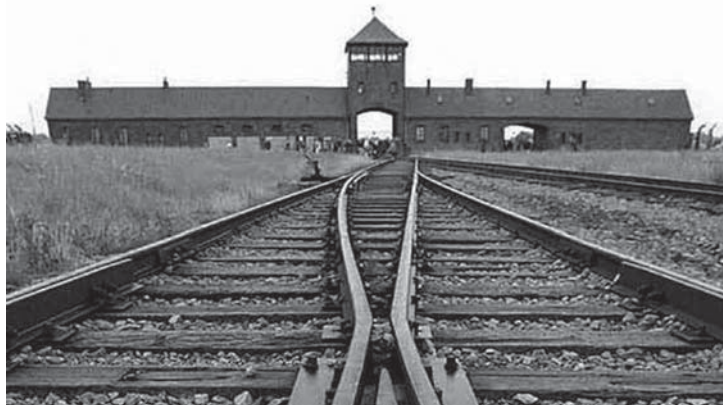
The Auschwitz Gate, as seen in Verdict On Auschwitz, a First Run Features Release. Over the course of 900 days - from the beginning of 1942 until November 1944 - approximately 600 special transports arrived at the death camp via the German National Railway.

දෙවන ලෝක යුද්ධයේදී ජර්මනිය විසින් පවත්වා ගෙන යනු ලැබූ විශාලතම වද කඳවුර ලෙස අවුල්විටිස් කඳවුර සැලකේ. එක්දහස් නවසිය හතළිහ සහ එක්දහස් නවසිය හතළිස් පහ වසර අතර කාලයේදී අති බහුතරයක් යුදෙව් ජාතිකයන් ඇතුළු දූෂ ලක්ෂයකට ආසන්න පිරිසක් නාසි හමුදා විසින් අවුල්විටිස් කඳවුරේදී ඝාතනය කරනු ලැබීණි. නාසි හමුදා විසින් යටත් කර ගනු ලැබූ යුරෝපා රටවල විසූ ලක්ෂ සංඛ්‍යාත යුදෙව් ජාතිකයන් මෙම කඳවුර වෙත ප්‍රවාහනය කරනු ලැබුවේ දුම්රිය මගිනි. මීට වසර හතේනවකට පෙර නාසි වද කඳවුරේ සිටි සිරකරුවන් බේරාගන්නා ලද්දේ යෝ-විසට් රතු හමුදාව විසිනි. ධනේශ්වර ලෝකයේ නිර්ධය විවේචනයට ලක් වූ සෝවියට් පාලනය නො-වත්හට ගිලිව විසින් ඇමෙරිකාව ඇතුළු ධනේශ්වර ලෝකයමය ගප කර දැමීමට ඉඩ තිබුණි.