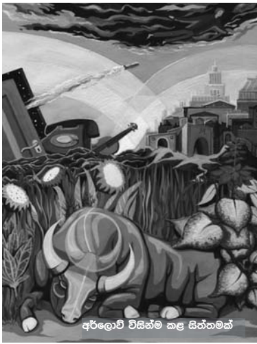
අර්ලොව් විසින්ම කළ සිතීමකක්