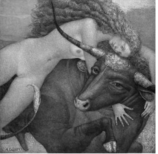
තිල වෘෂභයා සහ අනස්තාසියා අයුරුගොනාව (මේ පින්තූරවේ යුරෝපා සහ වෘෂභයා ගැන ග්‍රීක පුරාණෝක්තිය හදින් මතක් කරනවා)