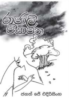
ජගත් ජේ එදිරසිංහ

ජගත් ජේ එදිරසිංහ ලියූ "කාලාග්නි" නවකතාව "වයෝලය දරා ගත් සිනියා" කාව්‍ය සංග්‍රහය සහ "රාජාලි පියාපන" කාව්‍ය සංග්‍රහයේ දෙවන මුද්‍රණය දැන් නිකුත් වී ඇත