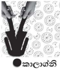
ජගත් ජේ. එදිරසිංහ