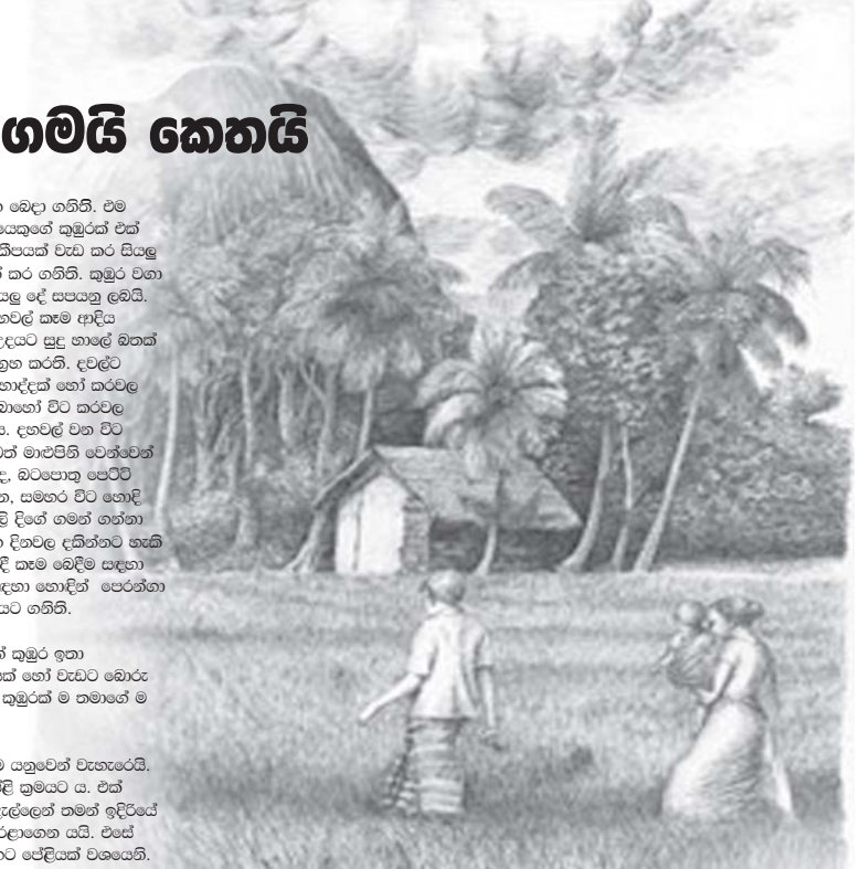
ගත්දෑවේ දී ඇදට බැස හා ගැහිම දවසේ වෙහෙස හිචලන සුචලායක සරසකට හේතු වේ.

කුඹුරු කෙටීමේ ක්‍රමයට අමතරව සී සෑම යන මැඩවීම සිදු කර කුඹුරෙහි මඩ සාදා ගැනීම ද කරනු ලැබේ. තතුල නම් සී සාන උපකරණයට ගවයන් දෙදෙනකු බැඳිය හැකි ය. ගවයන් විසින් තතුල ඇඳගෙන යන අතර හරකුන්ට පිටුපසින් තතුල ඇඳගෙන යන ගොවියා හිසි පිළිවෙළට මඩ පෙරළී යන ආකාරයට එය හසුරුවයි. අභිලයන් මාමලාගේ ගෙදර තතුල කිරිපයක් ම පිටුපසින් අතර හරක් ද කිරිප දෙකකු ඇති කරනු ලැබේ. මා ද අභිලයන් මාමලාගේ පුතුව වන ලෙසේ අධියා සහ සෝමළාස, සමඟ සී සෑමේ යෙදී ඇත. එවකට සිරිසේන, රාජා සහ පුළු අස්පුනාමී යන අය මට වඩා කුඩා ය.