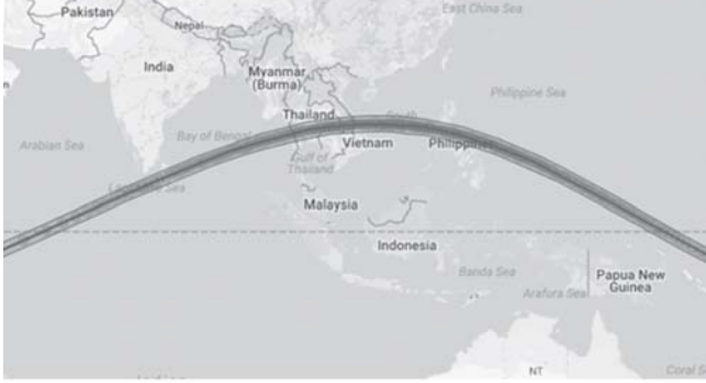
පූර්ණ සුර්යභ්‍රමණය ඉතා හොඳින් දිස්වූ පර්ය

සියලුම ආරෝග්‍යශාලා අධික ලෙස බඩ විරේකයෙන් සහ වමනයෙන් පීඩා විදින කාන්තාවන්ගෙන් පිරි ඉතිරි යන්නට විය. මෙය රටෙහි මහත් ආන්දෝලනාත්මක සිද්ධියක් විය. ඊටපසු දිනපතාම වාගේ, අධික විරේකය නිසා තදබල ලෙස මත්පැවු කාන්තාවන් ගැනද අසන්නට ලැබුණි. ඒ බොහෝ දෙනෙක් හොර රහසේම කුටි වෙළුනුගෙන් ලබාගත් වදකන කෂාය බි