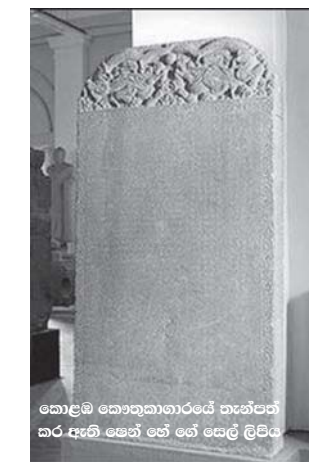
කොළඹ කොතුකානාරයේ තැන්පත් කර ඇති පෙන් හේ සෙල් ලිපිය

නපුංසක පෙන්-හෙ සහ අනෙක් අය විවිධ රටවල නානාපතින් ලෙස බටහිර සමුද්‍රයට යවන ලද අතර ලංකාවෙන් අල්ලා ගන්නා ලද යා-ලිකු-නා-යිර් (ya-lier-ku-nai-er) රජු සහ මනුෂ්‍ය පවුලේ සාමාජිකයන් අද දින රාජ සභාවට ඉදිරිපත් කරන ලදී. පෙර දිනක පෙන්-හෙ ලංකාවට පැමිණි විට යා-ලිකු-නා-යිර් මනුෂ්‍ය අගොරුව වන ලෙසත් අපහාසාත්මක ලෙසත් හැසිරෙන ලදී.