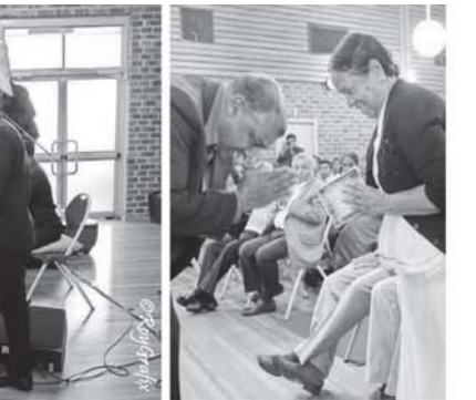
අවුරුදු විලිදියේ උමා ගීත ගායනයේදී කැටහන කළ ගී සිහිපයක් වෙතෝ. එහිදී ඒවා අද අවුරුදු විලිදියේ අසන්නට ලැබෙතෝ අයුරි.

කාලයේ ඇවිමෙන් ප්‍රභංග හා සුඛ අරාධනයට ගීත ගායනයට අවදාරාව ලැබෙන අතර පී චීනියෝගේ ගායනා අවේච්චිත බාලපුරුදු මගායන් ආරාධනයෙන් 'කේදන වික්රම' වැඩසටහනට 'සිහිලෝ සුළුගක' නම් වූ ගීත ගායනා කරන්නට ලැබෙතෝ.