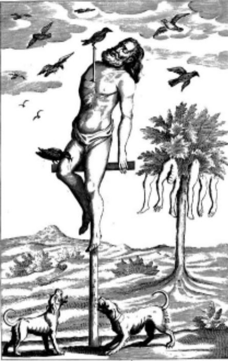
One Impaled on a Stake.

මෙපිට ක්‍රියාත්මක කර නැත. ඒ අනුව මරණ දඬුවම ක්‍රියාත්මක වන්නේ රටවල් 54 ක පමණකි. මේ රටවල් අතරට චීනය, ඉන්දියාව, ඇමරිකා එක්සත් ජනපදය (ජනපද 50 හි 32 ක්) හා ඉන්දුනීසියාව යන ලෝකයේ වැඩිම ජනගහනයෙන් යුතු රටවල් හතර අයිතිවීම නිසා ලෝක මිනිස් ප්‍රජාවෙන් 60%ක් තවමත් මේ නිරිසන් නීතිය යටතේ ජීවත්වෙන බව කිව හැක. පසුගිය වසරේ වැඩිම පිරිසක් මරණ දඬුවම ලබා ඇත්තේ