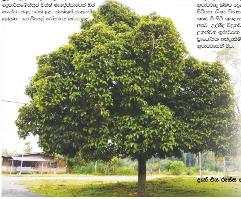
දැන් එය රූපික ගසක් වී තිබේ.

මූලික වැඩ අවසන් කළ පසු, කුලආසන් සර්ගේ උපදෙස් අනුව උද්ගිඳ උයන තුළ, ජලජ පරිසරයක්, ශුෂ්ක පරිසරයක්, අවිශාක, පරපෝෂිත ශාක, ගුගුන කඳුන් සහිත ශාක, විවිධ ආරෝහක ශාක, මීමහ, ඕකිඩි, බාඳුරා වැනි සුවිශේෂ ශාක වැවිය හැකි ස්ථාන, ඒ ඒ ශාක වලට ගැලපෙන පරිදි සකස් කරන ලදී. විදුහල් භූමියට ආසන්නයෙන්ම දිවෙන උඩරට දුම්රිය මාර්ගය පැත්තේ හොඳින් ආලෝකය වැටෙන කොටසේ, විශාල වාක්ෂ ලෙස වැඩෙන, ප්‍රදේශයේ බහුලව හොමැති පලතුරු ශාක කිහිපයක්ද රෝපණය කිරීමට තීරණය විය.