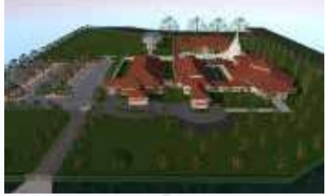
දරුවන්ට හැකිවෙමින් පැවැත්ම සතුටට කරැණකි.

මෙම විහාරස්ථානය පවත්වාගෙන යාම පමණක් නොව ප්‍රදේශයේ වසන දරුවන්ට සිංහල අධ්‍යාපනය ලබාදීම සඳහා ආරම්භ කරනලද සිංහල භාෂා පාසැලද මෙම විහාරස්ථානයට සමගාමීව සංගමය විසින් පවත්වාගෙන ගිය අතර බෞද්ධ වටපිටාවක් තුල සිංහල භාෂාව හැදෑරීමට අප