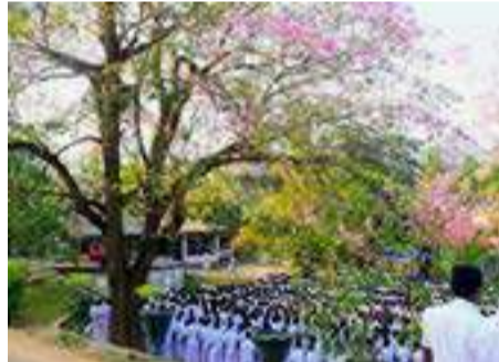
උපාසනය සඳහා සිසු සිසුවියෝ පෙළ ගැසෙති

එදා, තාගෝර් තුමා විසින් රෝපණය කරන ලද, සියඹලාව අද වයෝවෘද්ධ රූස්ස ගසකි. උපාසන මළුව, එම සියඹලා ගස දක්වා විහිදී යයි. උපාසන මළුව වටා සහ විදුහල් බිමේ තවත් ස්ථාන කිහිපයකම, අප්‍රියලේ මැයි මාසවලදී මුළු ගසම රෝස පැහැති මලින් බරවන Tabebuia rosea ශාක සමූහයක් තිබේ. විදේශීය ශාකයක් වන මෙය 'රොබොරෝසියා' යන අන්වර්ථ නාමයකින් හැඳින්වීමට ශ්‍රී පාලියේ කවුරුන් පුරුදුව සිටිති.