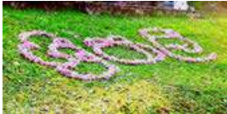
රොබොරෝසියා මල් වලින් නිමවූ 'ශ්‍රීපාලි' නම

උපාසන දිනයේ උදෙන්ම පාසලට පැමිණෙන ඔව්හු බිම වැටී ඇති 'රොබොරෝසියා' මල් අහුලා, ඒවායින් උපාසන මළුව බඩවුමේ සිත් ඇදගන්නාසුලු නිර්මාණ සකස් කරති. එසේ කරන ලද එක් නිර්මාණයක ඡායාරූපයක් පහත දැක්වේ.