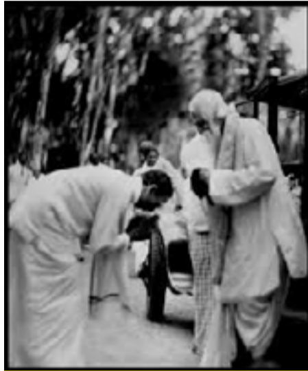
විල්මට් ඒ පෙරේරා මැතිතුමා විසින්, ශ්‍රීපාලි පර්ශ්‍රයට පැමිණි, තාගෝර් මැතිතුමා සාදරයෙන් පිළිගැනීම (1934 වසරේදී)

1934 වර්ෂයේදී, හොරණයේ මහාකවි ගුරුදේවී රබින්ද්‍රනාත් තාගෝර් පඩිවරයා ශ්‍රී ලංකාවට සැපත් විය.