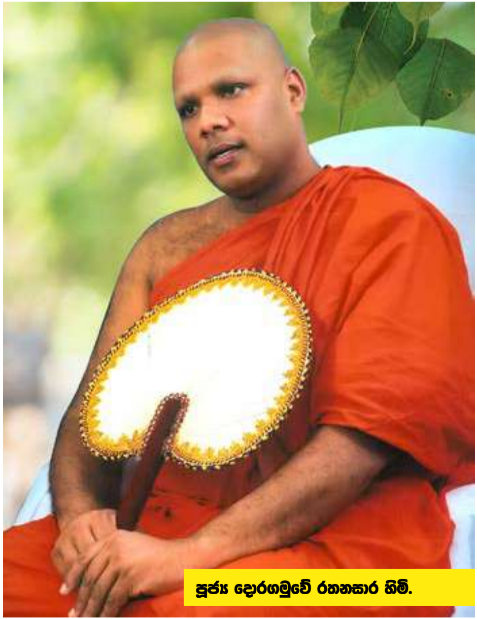
ත්‍රෑය දොරගමුවේ රතනසාර හිමි.

පත් වූ සේක. 2001 විද්‍යාලංකාර පිරිවෙනෙන් අස් වුවද ලද හැම විටෙකම දහම් පොතපත කියැවීමෙන් බර්ම සාකච්ඡා කිරීමෙන් නාවීමෙන් අරියබිම්ම හිමි ප්‍රභව වැඩ සිටිමින් භාවනා කිරීමෙන් ගොඩ නගා ගත් බර්ම ඥාණය පාදක කර ගෙන සිය දායක පිරිස වෙත දුන් සුපැහැදිලි බර්මදානය හේතුවෙන් අසීමිතව පැහැදුන දායක පිරිස හිමි වටා රොක් වූහ. ඔවුන්ගේ නොමසුරු උදව් උපකාර ඇතිව ගොඩනැගූ බර්ම දුත විහාරස්ථානය යන එන ඕනෑම අයෙකුගේ නෙත් සිත් ශාන්තියට පත් කරවන්නේය. බෞද්ධයා, විදුල රූපව ධර්ම සේවාවන්වලට ද, බෞද්ධයා ගුවන් විදුලිය මහනුවර සේවය ආදී ස්ථාන සඳහා සහ වෙනත් බර්ම දේශනා ආදිය නිසා ඉතා අවිචේකී දිවියක් අප සමිඳුන් ගත කලත් තම විහාරස්ථානයට පැමිණෙන ඕනෑම සැදැහැවතෙක් සඳහාද උන් වහන්සේ කිසිදු පැකිලිමකින් තොරව දහම් දෙසන්නේ ඔවුනට නිවනේ මාර්ගය පැහැදිලි කර දීමටය. දායක කාරකාදීන්ගේ උදව්වෙන් ගත් සුන්දර අඹ වනයක අඹ ගස් යට භාවනා කිරීම සඳහා භාවනා කුටි ඉඳි කිරීම සඳහා අප සමිඳුන් තවත් පියවරක් ගෙන ඇත්තේ ඉතා කලාතුරකින් ලැබෙන මනුෂ්‍ය ආත්ම හවයේ දී සැදැහැවතුන් සසරෙන් එතෙර කිරීමේ උදාර බලාපොරොත්තුවෙනි. ශ්‍රී ලංකාවට පැමිණි අවස්ථා වක උන්වහන්සේ බැහැදැකීමට ඔබටත් මින් ආරාධනය කෙරේ. දුරකථන: +94 812 223 780