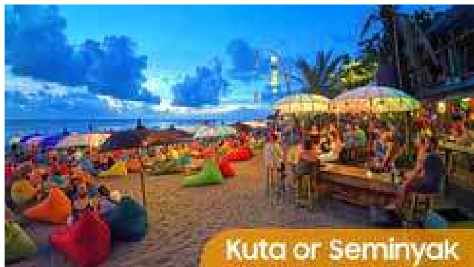
Kuta or Seminyak

මේ සිද්ධස්ථානයට ඇතුළුවීමේ ගාස්තුව විදේශිකයෙකුට රුපියල් 60,000 ක් (ළමුන් සඳහා 30,000 ක්) වෙනවා.